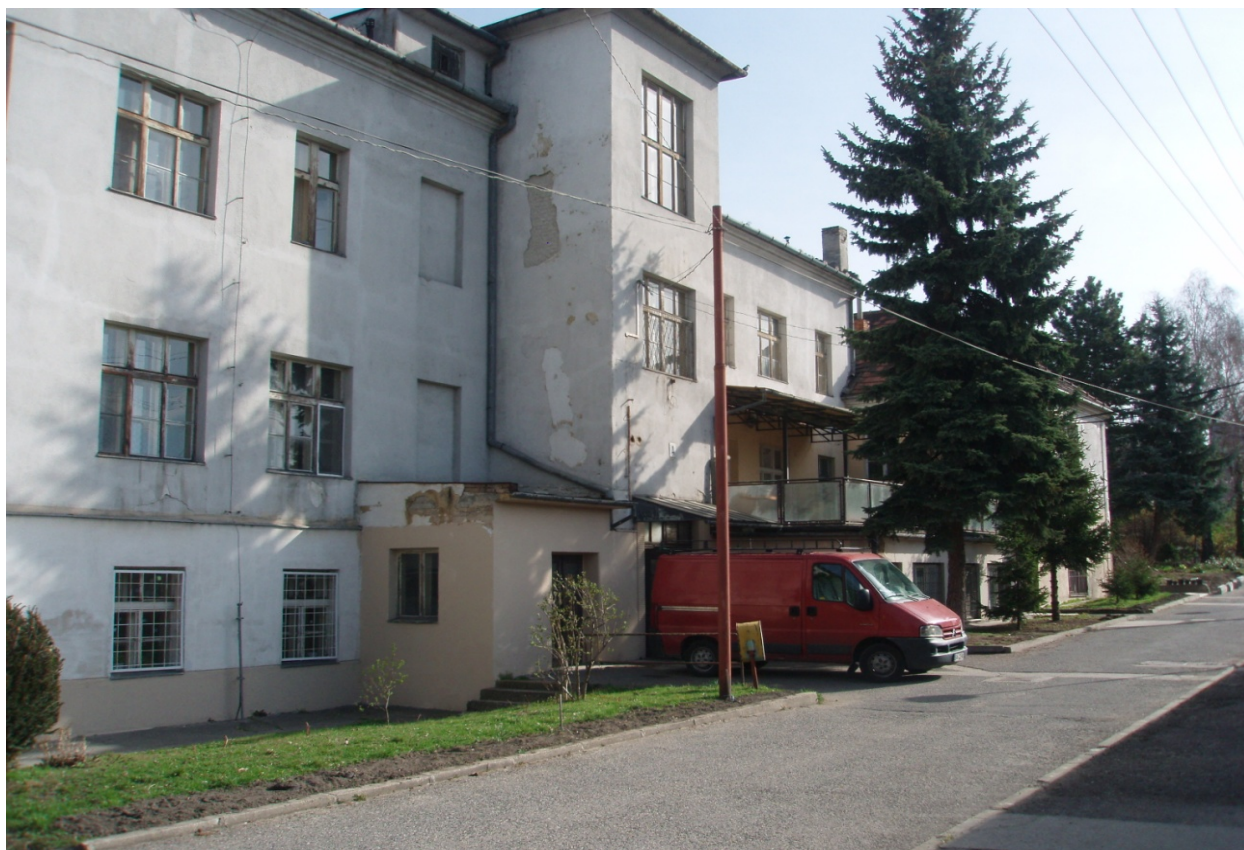
"Budova ŠZŠ" súpisné číslo: 3398 (parcelné číslo: 2642)