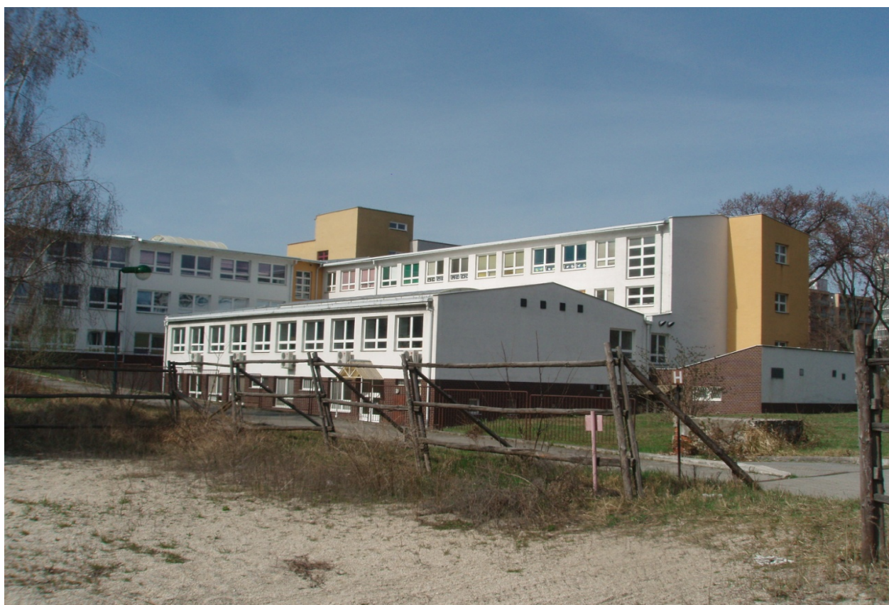
"Budova H" súpisné číslo: 6015- ÚSS pre TPM-lôžková časť, (parcelné číslo: 2651/1)