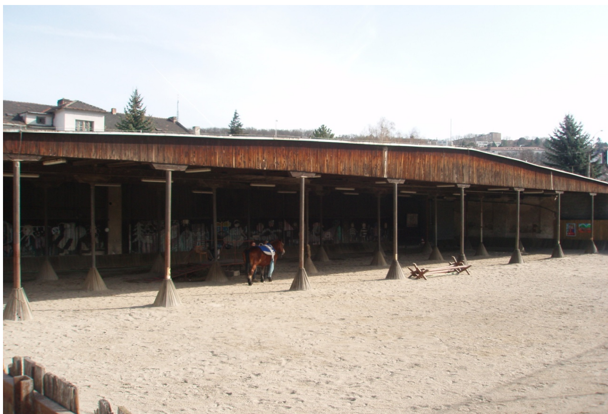
"Budova L" súpisné číslo: 6035 – garáže (parcelné číslo: 2645/5)