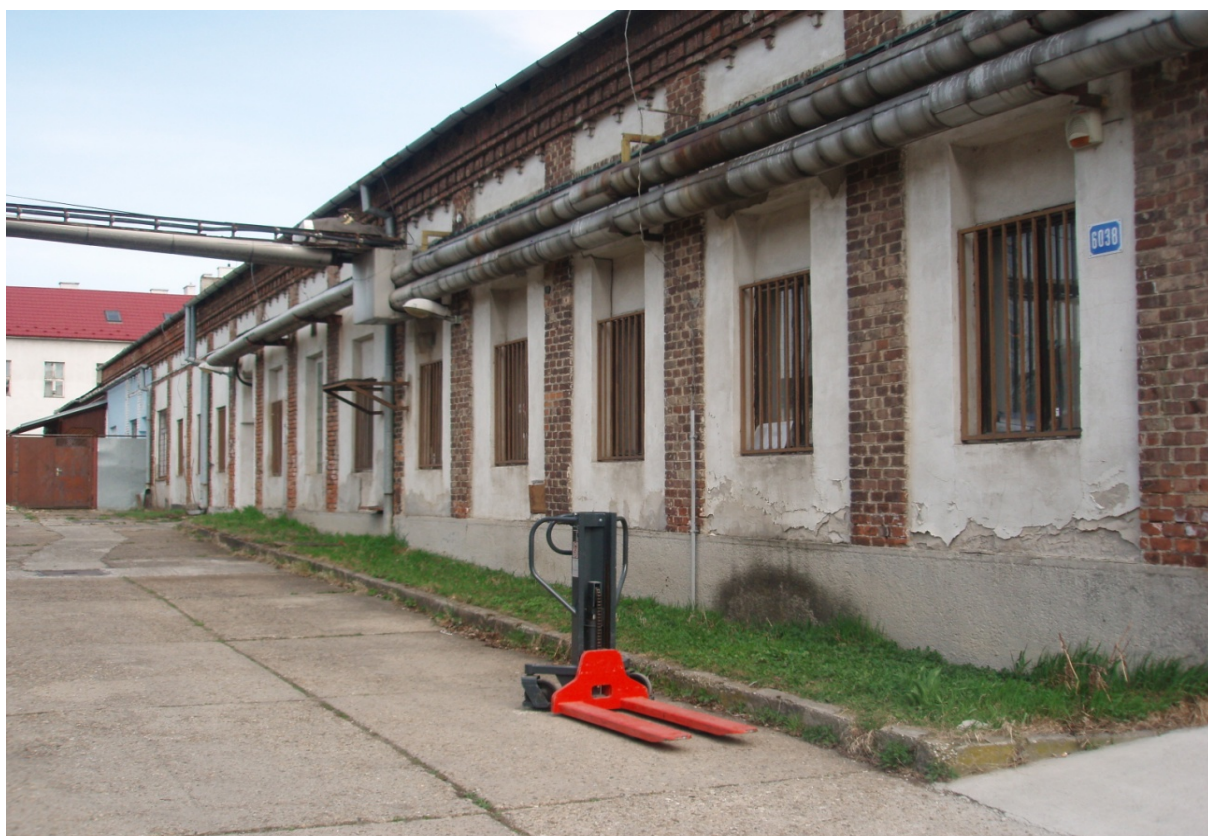
"Budova M" – kult.miestnosť, súpisné číslo: 5971 (parcelné číslo: 2667/1)