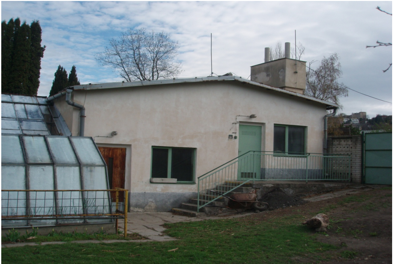
"Budova E" súpisné číslo: 6014- ÚSS pre TPM-internát (parcelné číslo: 2648/1)